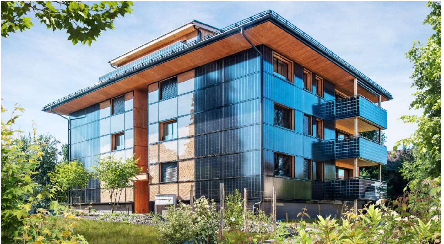
1 Das 315% NF Min.P/PlusEnergie-MFH produziert jährlich 78'000 kWh Solarstrom statt 137'700 kWh/a fossil-nukleare Energien zu verbrennen.