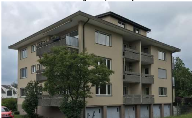
2 Statt 41 t CO 2 zu emittieren werden jährlich 125 t CO 2 -Emissionen vermieden.