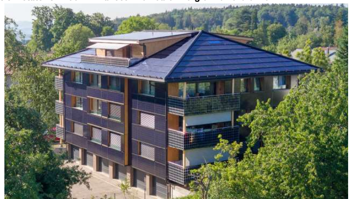
3 Stromüberschuss 53'300 kWh/a: 35-E-Autos vermeiden 84 t CO 2 -Emissionen.